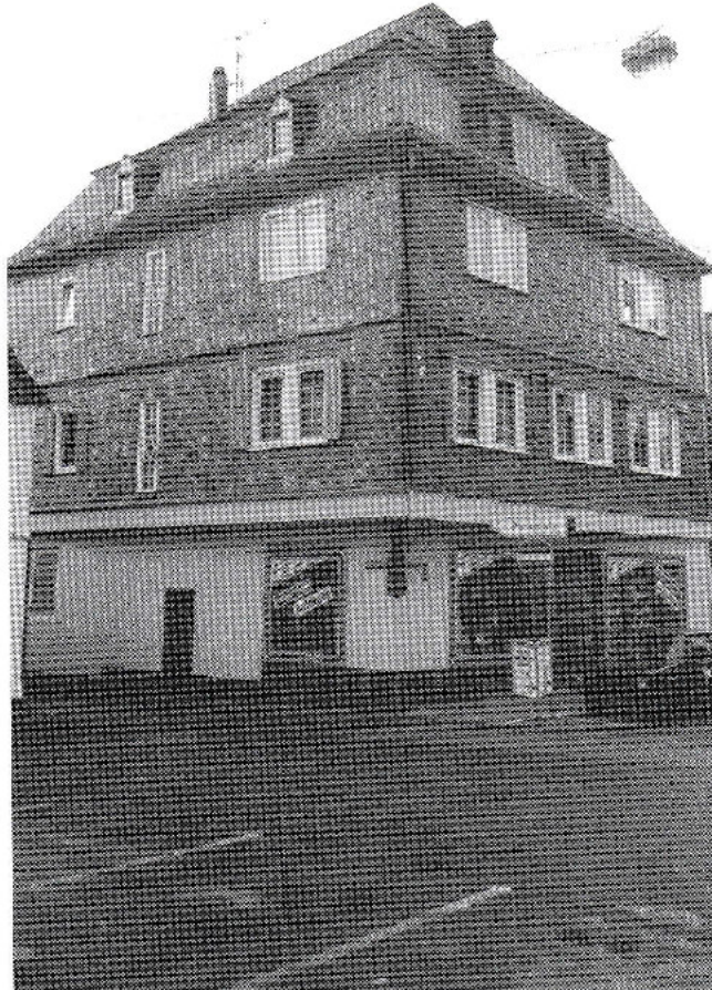
Das ehemalige Haus der Familie Katzenstein in Kastellaun, Marktstraße (Aufnahme 1990).

gegen die Juden war die gesetzmäßige Diskriminierung durch die Verkündung der „Nürnberger Gesetze“, dem nach der endgültigen Ausschaltung der Juden aus dem wirtschaftlichen, politischen und gesellschaftlichen Leben die Wannseekonferenz mit der „Endlösung der Judenfrage“ in den Gaskammern der Konzentrationslager folgte.