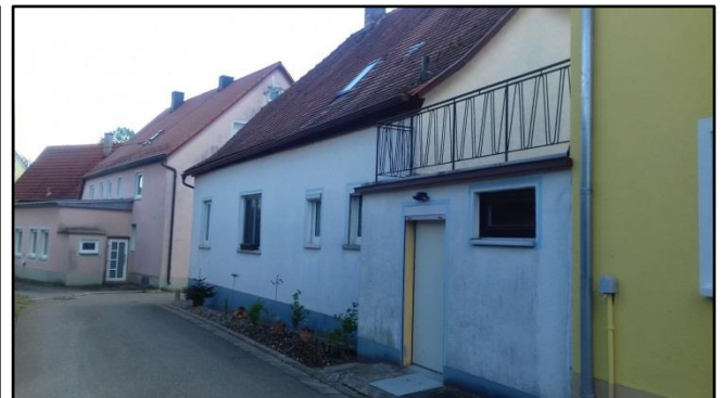
Rückseite von der Gartenstrasse. Der rückwärtige Eingang für die ausländischen Arbeitnehmer wurde zugemauert.