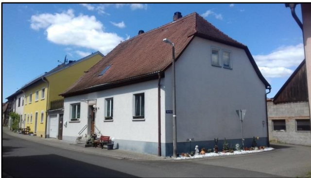
Das Gebäude im Jahre 2020. Auf der östlichen Giebelseite befand sich bis in die 1950er Jahre der Anbau der Tora-Nische.