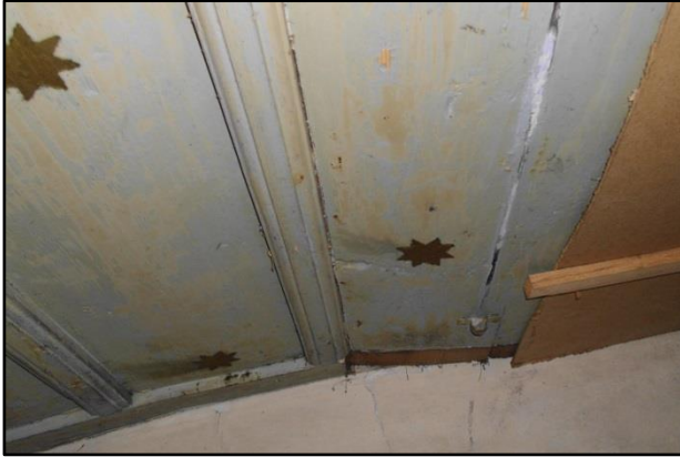
Hier auf dem linken Teil des Obergeschosses ist der Himmel teilweise übertapeziert worden. Deutlich ist noch ein Teil des Tonnengewölbes erkennbar. Auch auf dem Bild rechts ist