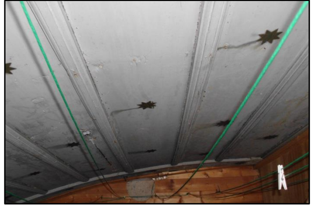
ebenfalls das Tonnengewölbe erkennbar. Die hell-blaue, dem Himmel nachgebildete Farbe, mit den exakt angeordneten Sternen bis dato erhalten geblieben.