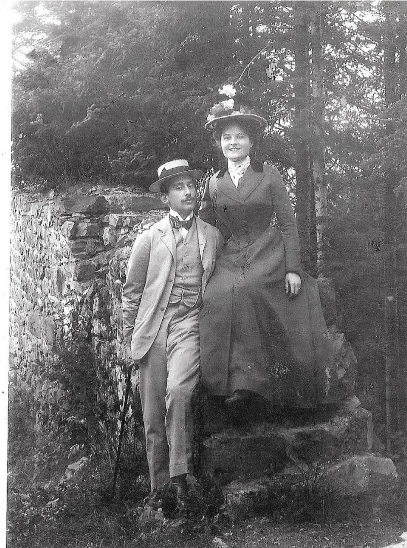
Fotos ca. um 1900