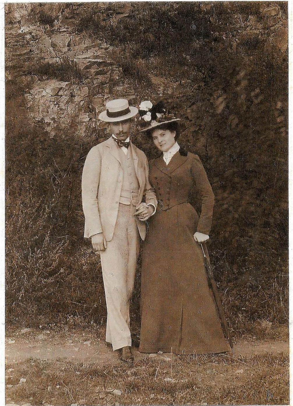
Fotos ca. um 1900